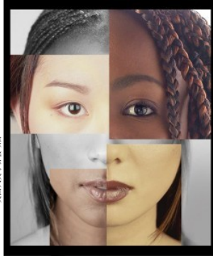
http://www.substantive.org/home.html 美国反歧视委员会

因为您的种族或颜色而被拒绝提供住房，只允许您进入公寓大楼的某些区域，或被诱导前往“专门租给像您这样的租户”的小区属于住房歧视。如果住房提供者在电话里告诉您有公寓可租，但当您亲自前往查看该住房单元时，他突然不出租了，则您可以指控遭到了住房歧视。诸如“我刚刚将最后一个单元租出去”、“我丢失了您的申请书”或“您的信用不完美”之类的言论都可能是歧视的迹象。当您入住之后，可能会因为种族或肤色而无法获得维修服务、不能平等使用物业/住房设施、遭到驱逐或骚扰。